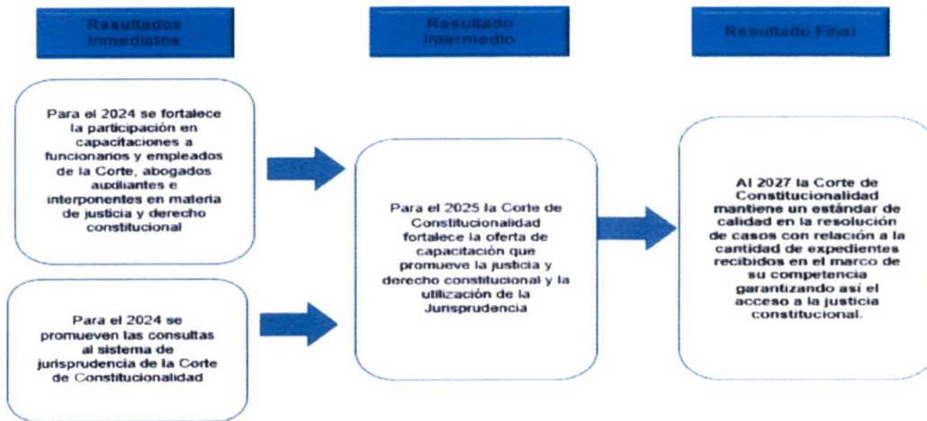
Figura 3. Resultados institucionales

Nota. Conforme lo indicado en el Plan Estratégico Institucional de la Corte de Constitucionalidad 2022-2027. Página 17.